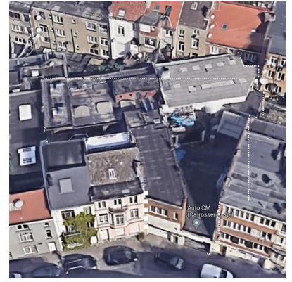
Suggestions d'implantation et de volumétries