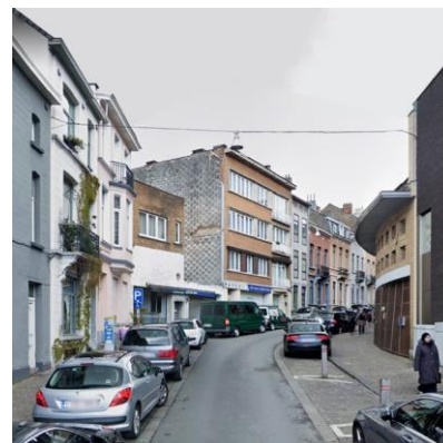
Rue Brichaut : suggestions Brichaustraat: suggesties